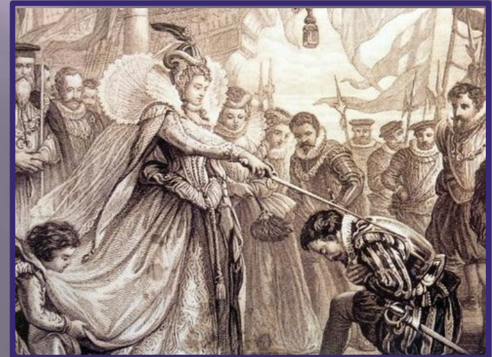
Fotografía: Francis Drake recibiendo la orden de caballero de manos de la reina Isabel I Tudor © Wikipedia.